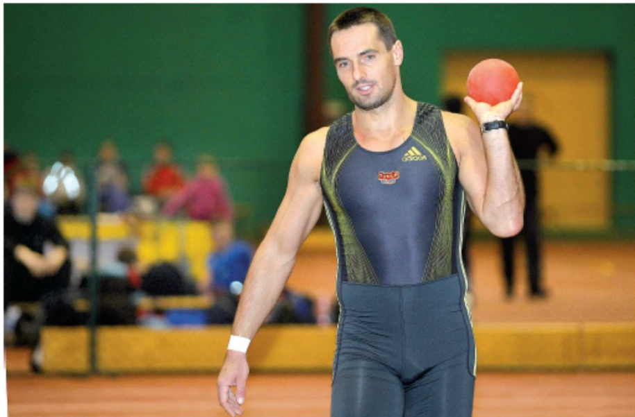
PŘED VŘHEM KOULÍ. V Otrokovicích včera začal 12. ročník atletického halového mítinku Otobly Morava. Diváci mohli na živo sledovat mimo jiné neúspěšnějšího desetibojáře planety posledních let Romana Sobřicha, který testuje svou formu před nadcházejícím halovým mistrovstvím světa v katarském Dauhú. Olympijský vítěz, evropský a světový šampion první den mítinku vrhal kouli, dnes se představí v dálkařském sektoru. (of)